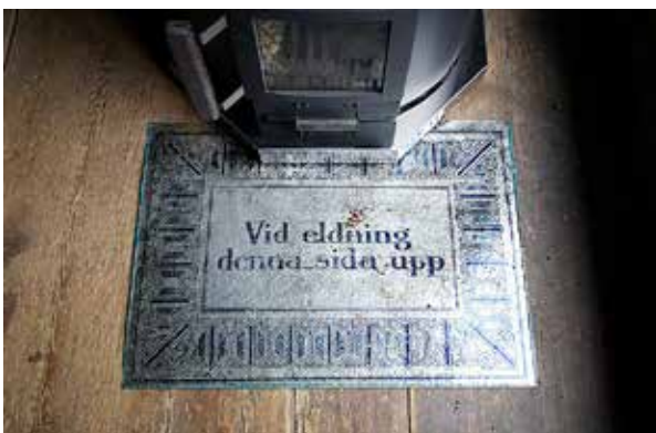
"För brandrisken skull så ska man även ha ett gnistskydd framför kaminen. Den här gamla flyttbara och vändbara skyddet som har tillhört en kakelugn hittade jag på vinden i vårt hus."