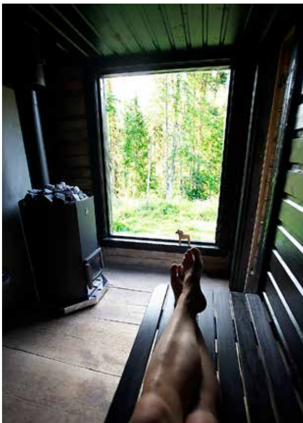
200 år gamla golvplankor med patina. Kan det bli häftigare än så här?