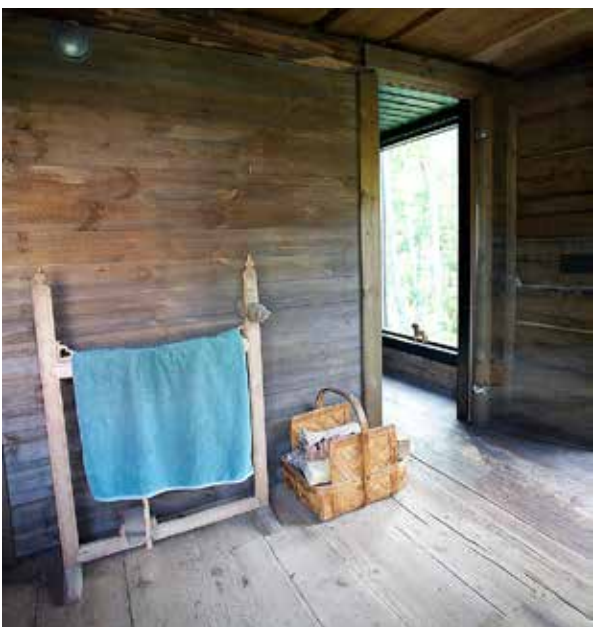
Vägg målad med Te/vinäger. Näverkorg som kom med gården. En gammal vävstol som man bland annat gjorde band till folkdräkter med är numera handdukstork.