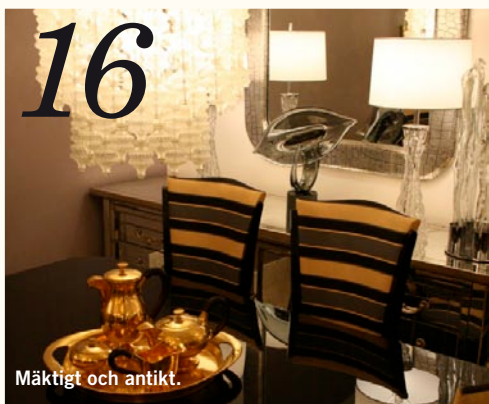
Mäktigt och antikt.

En kitschig och lite barnslig affär. Leksaker och prylar som du inte trodde du behövde (och kanske inte heller gör).