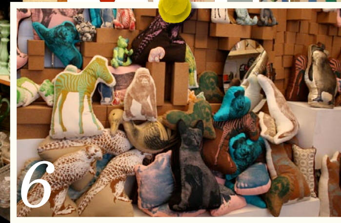
Kiosk, lite hemlig, experimentell, men väldigt skojig affär.