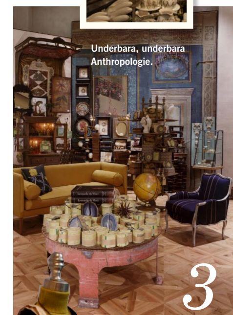
Underbara, underbara Anthropologie.