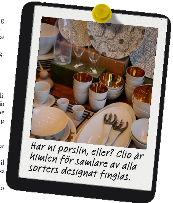
Har ni porslin, eller? Clio är himlen för samlare av alla sorters designat finglas.

8. Clio 92 Thompson Street, tel 212 966 8991, clio-home.com. Designat porslin, glas och vaser. Mycket färger och unika föremål. Samlarporslin-butik kanske man kan kalla det. Eller rättare sagt framtidens Stig Lindberg säljs här. >>