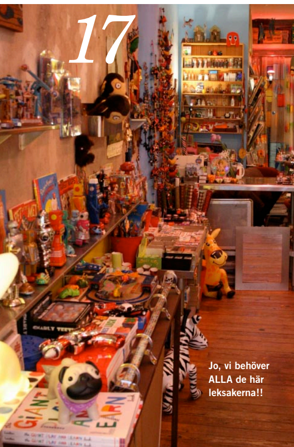
Jo, vi behöver ALLA de här leksakerna!!